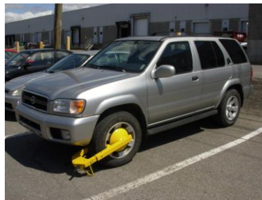
VUS et camions 4x4