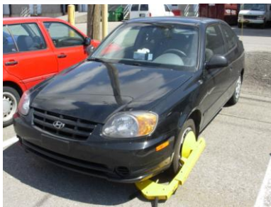
Pour toutes les voitures

Utilise le meme mode de fixation "vise-serré" que les sabots plus dispendieux mais sa construction en acier est plus abordable.