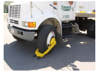
Camions et tracteurs